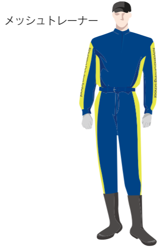
メッシュトレーナー

汚れに強く破れにくいナイロン素材を使用。左腕には便利なベン差し(2本分)がついています。