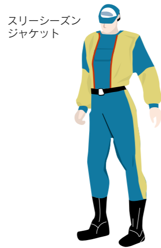
スリーシーズン ジャケット

汚れに強く破れにくいナイロン素材を使用。左腕には便利なベン差し(2本分)がついています。