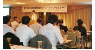
のべ100名を超える方が参加されました

現代は4人に1人が65才以上、8人に1人が75才以上です。認知症患者の割合は65才以上の15.7%。予備軍も含めて900万人いると言われています。よく、認知症と物忘れの違いを聞かれることがありますが、食べた物が思い出せないのが、物忘れ。食べたこと自体を忘れてしまうのが認知症です。認知症は本人の自覚がなく、病院にも家族に連れてこられるケースがほとんどです。加齢のパターンには男女差があり、男性は女性に比べ、ガン・動脈硬化などの割合が多く、中年期以降に命を取られるような病気になりやすい。女性はジワジワと衰弱していき、認知症の確率が男性より高いのです。