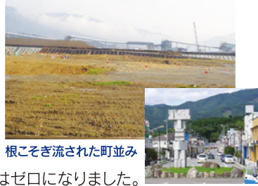
根こそぎ流された町並み

皆さんは自分の会社の売り上げがゼロになるということが想像できますか？陸前高田の我が校は1996年に海岸地域から高台に移転。そのため今回の地震では幸いお客様も社員も全員無事でしたが、町がなく